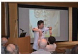
「腰痛などの予防とリハビリについて」