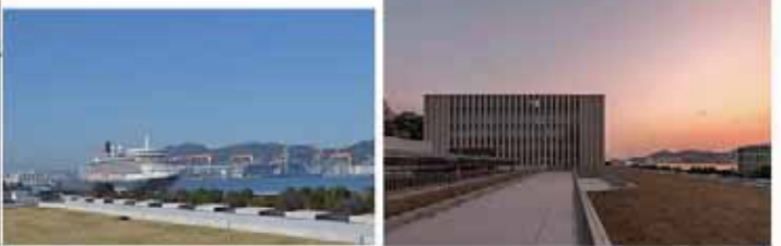
【屋上広場からの景観】