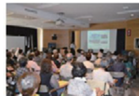
「近年の医療動向について」